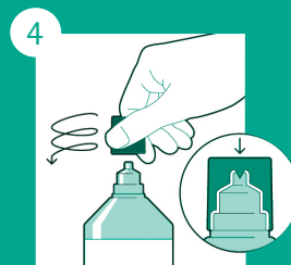
Recolocar a tampa girando em sentido anti-horário até romper o lacre.