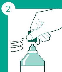
Girar a tampa no sentido horário.