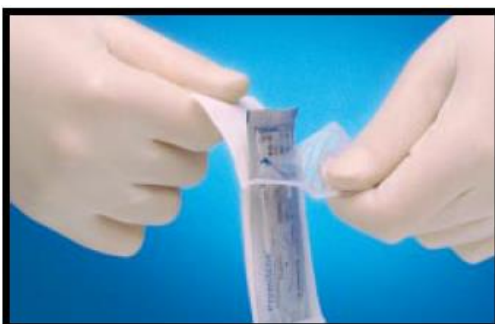
Abra o blister plástico